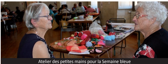
Atelier des petites mains pour la Semaine bleue