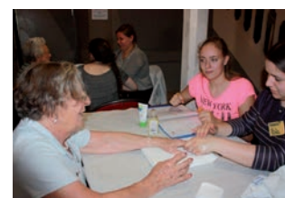
Séance bien-être en mai 2017

D'octobre à mai 2018 une quarantaine de séniors se sont rendus aux premiers ateliers intergénérationnels proposés par le service municipal CAP séniors et solidarité en partenariat avec les lycéennes du baccalauréat ASSP (accompagnement,