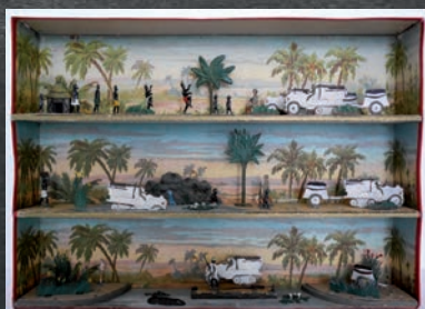
Boîte à jeux Citroën