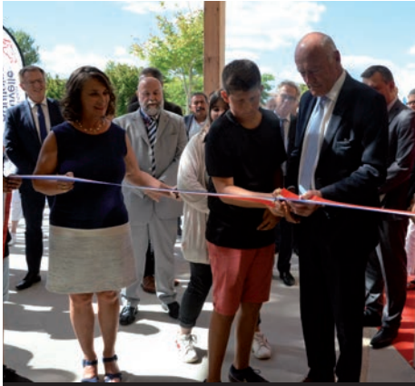
Inauguration de l'externat du lycée Blaise-Pascal