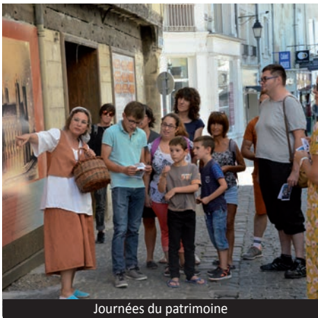
Journées du patrimoine