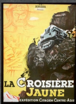
Affiche Croisière Jaune