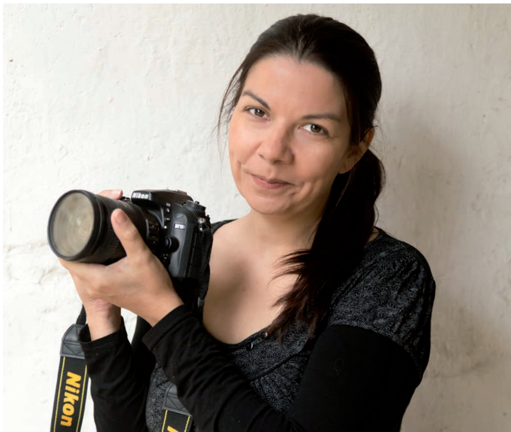
Agnès Riguet, photographe

En étroite collaboration avec le service municipal CAP séniors et solidarité, la photographe Agnès Riguet propose aux séniors de concevoir un livret regroupant photographies et textes autour de la transmission intergénérationnelle.