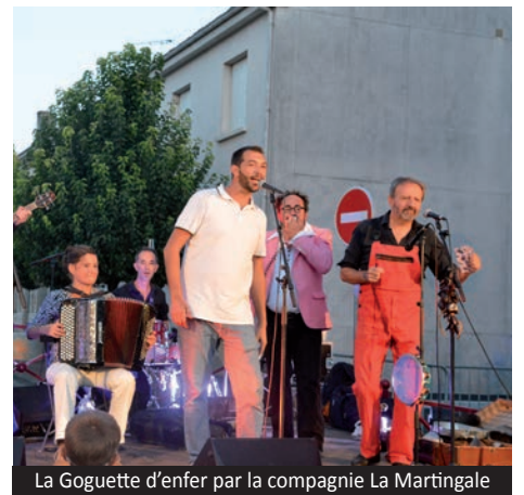
La Goguette d'enfer par la compagnie La Martingale