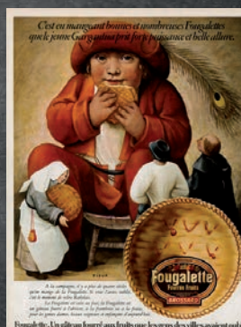
Publicité 1974 La Fougarelle Gargantua