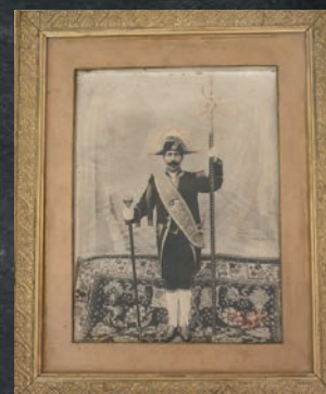
Photographie d'Adolphe Chaine