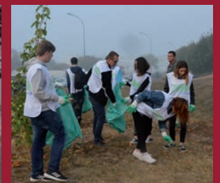
Les élèves du lycée Audoin-Dubreuil ont nettoyé les alentours du lycée et l'avenue Jacques-Richard