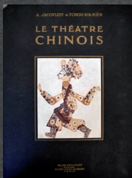
Album de Jacovleff, Le Théâtre chinois

Véritables invitations aux voyages dans le temps et dans l'espace, ces nouvelles œuvres sont appréciables dans l'exposition "L'Aventure Brossard" ou les premier mercredi du mois à l'occasion des visites des réserves.