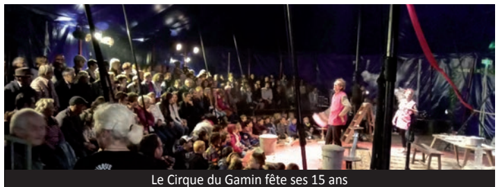
Le Cirque du Gamin fête ses 15 ans