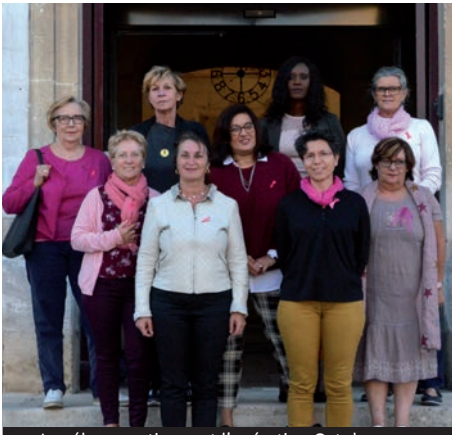
Les élues soutiennent l'opération Octobre rose