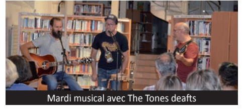
Mardi musical avec The Tones deafts