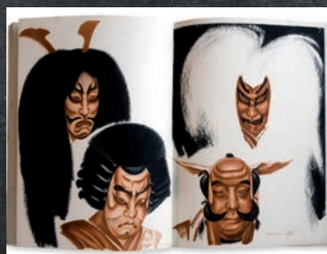
Album de Jacovleff, Le Théâtre japonais