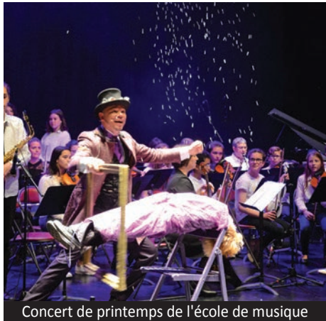
Concert de printemps de l'école de musique