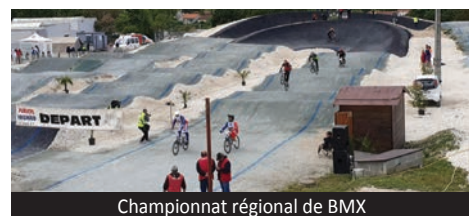
Championnat régional de BMX