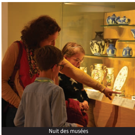
Nuit des musées