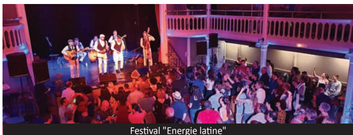
Festival "Energie latine"