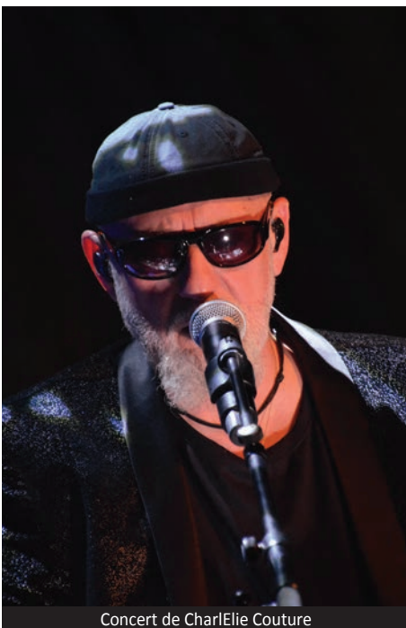
Concert de CharElie Couture