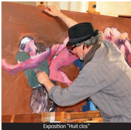
Exposition "Huit clos"