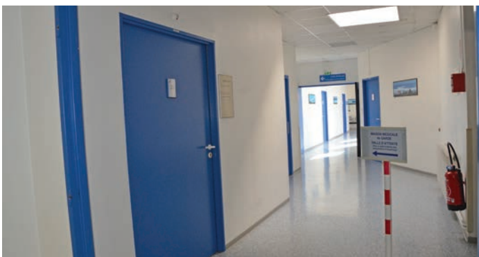
La Maison médicale de garde, située dans l'hôpital, à côté des urgences