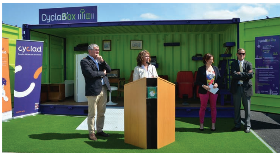
Inauguration de la déchèterie

V als de Saintonge et Saint-Jean-d'Angély sont depuis le 8 juin dernier équipés d'un nouvel outil pour développer l'économie circulaire avec l'ouverture de la nouvelle déchèterie Re.Cyclad, Zac de la Grenoblerie. Plus de la moitié des déchets produits sur le territoire arrive dans les déchèteries. Au regard des enjeux économiques et écologiques que cela représente, il est indispensable pour le Syndicat mixte Cyclad, engagé dans une démarche d'économie circulaire, de disposer d'outils permettant de