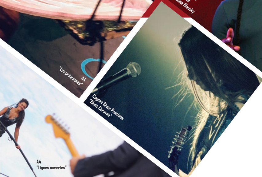
Block Session Purleston @ Louise Blonsky