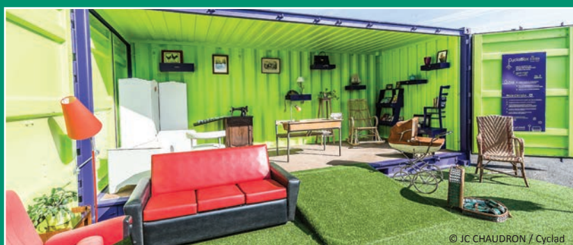
Consommer durablement avec la Cyclab'box

Cyclad installe à Saint-Jean-d'Angély la deuxième Cyclab'box de Charente-Maritime, véritable "module d'économie circulaire" dans la nouvelle Re.Cyclad. Cyclab'box est une véritable pièce de vie abritant des meubles, de la vaisselle, des livres, des jouets... Les objets en bon état sont sélectionnés et déposés par l'agent de déchèterie selon des critères prédéfinis et sont renouvelés régulièrement. Les habitants peuvent choisir les objets sélectionnés pour que les déchets des uns deviennent les trésors des autres.