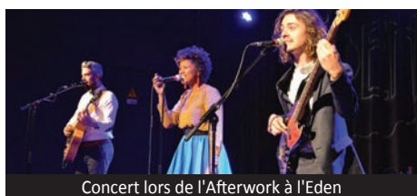
Concert lors de l'Afterwork à l'Eden