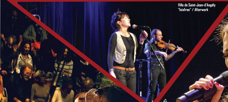
Ville de Saint-Jean-d'Angély "Inisfree" / Afterwork