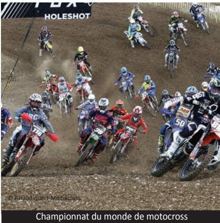
Championnat du monde de motocross