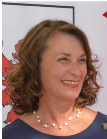
Françoise MESNARD Maire de Saint-Jean-d'Angély Conseillère régionale

L e mois de juin a été propice à de nombreuses inaugurations et démarrages de chantiers, signes tangibles d'une reprise d'activité sur Saint-Jean-d'Angély et son territoire. Parmi elles, l'ouverture de la nouvelle déchèterie, la pose de la première pierre de l'extension de l'hôpital, la mise à l'honneur du nouveau prestataire de l'aire de camping-car et le lancement du chantier du module thermal expérimental.