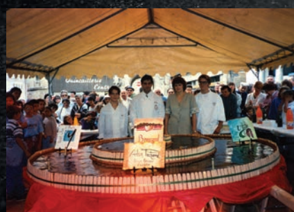
Charlotte géante confectionnée en 1999

D es boudoirs, de la crème, des fruits... de quoi faire de la Charlotte l'un de nos desserts préférés ! Si certains ont conservé sa recette sur d'anciennes boîtes de boudoirs Brossard, d'autres Angériens se remémorent la charlotte géante confectionnée en 1999 dans la cour de l'abbaye pour sauver l'usine de Papy Brossard. Pour célébrer l'exposition "L'Aventure Brossard" présentée jusqu'au 8 septembre, le musée des Cordeliers organise une compétition originale et inédite. Mercredi 17 juillet (jour de la sainte Charlotte), venez participer au concours de la meilleure charlotte. Le matin, entre amis ou en familles, chaque équipe en lice préalablement inscrite devra réaliser sa charlotte. L'après-midi, rendez-vous dans les jardins du musée pour une dégustation qui réunira les gourmands et un jury de professionnels triés sur le volet pour décerner le prix. Sur inscription au 05 46 25 09 72 dans la limite des places disponibles. Après-midi ouverte à tous. Animation gratuite