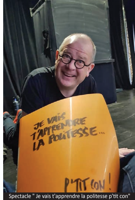
Spectacle " Je vais t'apprendre la politesse p'tit con "